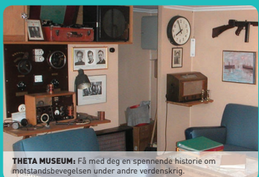
THETA MUSEUM: Få med deg en spennende historie om motstandsbevegelsen under andre verdenskrig.