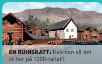
EN RUINSKATT: Hvordan så det ut her på 1200-tallet?