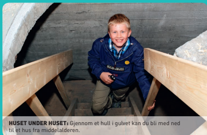
HUSET UNDER HUSET: Gjennom et hull i gulvet kan du bli med ned til et hus fra middelalderen.