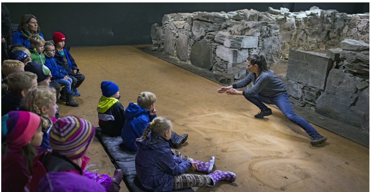
UNDER HUS OG GATE: Publikum ledes gjennom en port og tilbake til middelalderen. Et lekent fortellende møte med Norges eldste rådhus.

«Det var flere jeg snakket med som ble begeistret når de hørte at de kunne ta Beffen. De hadde ikke fått det med seg at den gikk den dagen, og at den var gratis.»