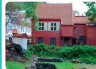
For alle. Dropp inn. Arr: Museum Vest – Det Hansasitke Museum og Schøtstuene

Bli med inn i våre Anno-kuliser! Prøv bl.a. å lage sletkstre, skriv med penn og blekk, legge puslespill, sette skjegget på torsken og lage hoppetau.