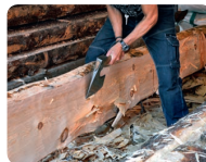
For alle. Dropp inn. Sted: Bryggestredet/Svengsgården. Arr: Stiftelsen Bryggen

Hvordan restaurerer vi Bryggen? Demonstrasjon av tradisjonelt verkøy og teknikker. Muligheter for publikum å prøve seg under veiledning av Stiftelsens dyktige restaureringshåndverkere!