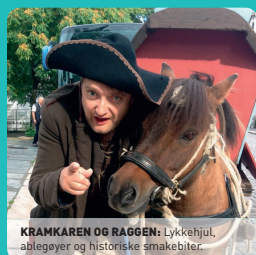
KRAMKAREN OG RAGGEN: Lykkehjul, ablegøyer og historiske smakebiter.