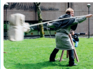
Oppmøte: Dreggalsmenning. Fra 5 år. Dropp inn. Arr: Tidsreiser

Bli med på leker som har blitt lekt i uminnelige tider på sletten på Dreggalsmenning. Prøv 3 forskjellige leker som har moret barn og voksne i århundrer!