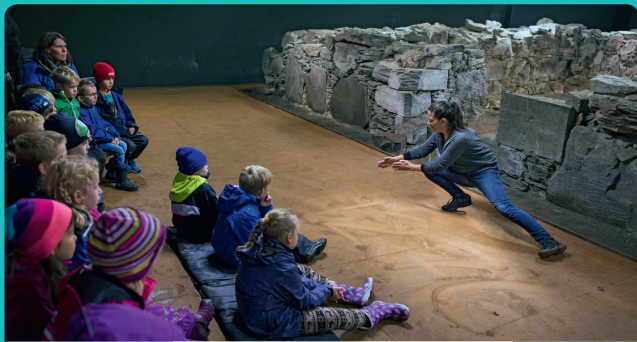
UNDER HUS OG GATE: Publikum ledes gjennom en port og tilbake til middelalderen. Et lekent fortellende møte med Norges eldste rådhus.