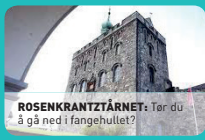
ROSENKRANTZTÅRNET: Tor du å gå ned i fangehullet?